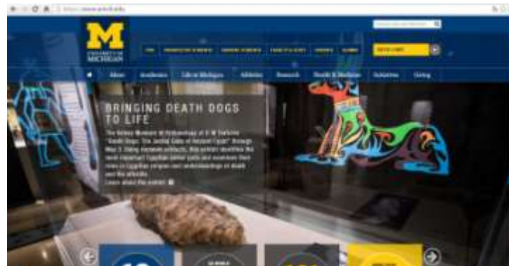
Λογότυπο και αρχική σελίδα του Πανεπιστημίου του Michigan