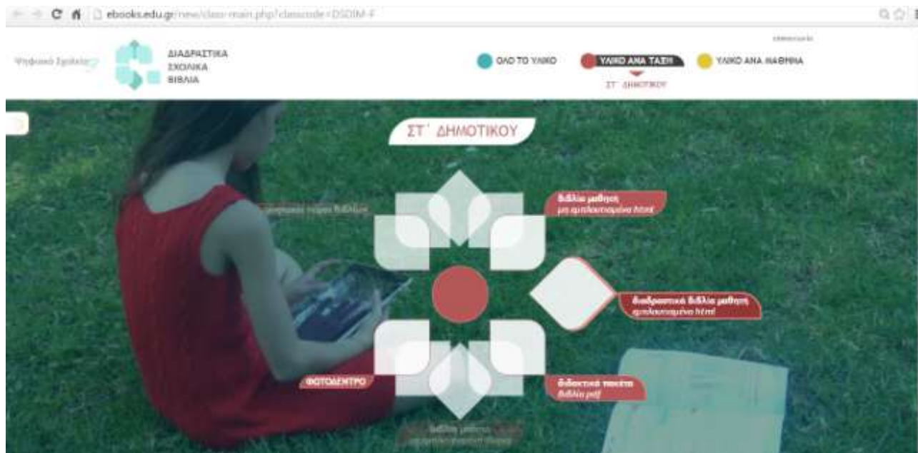
Ο ιστότοπος των Διαδραστικών Σχολικών Βιβλίων

➔ Το χρώμα μπορεί να χρησιμοποιηθεί σα μέθοδος κωδικοποίησης και, λειτουργώντας σαν οπτικός οδηγός, να διευκολύνει την πρόσβαση στις πληροφορίες που μεταφέρει.